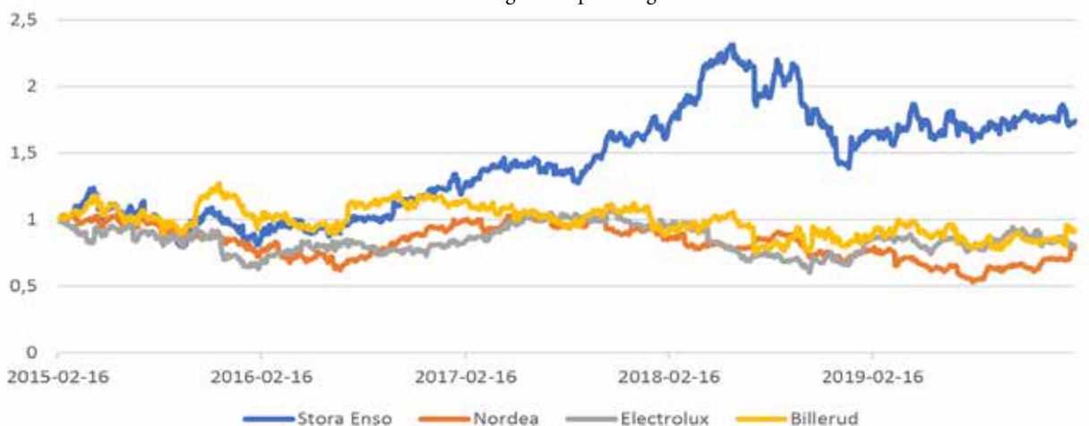
Bolagen (5 År) Historisk utveckling* för exponering